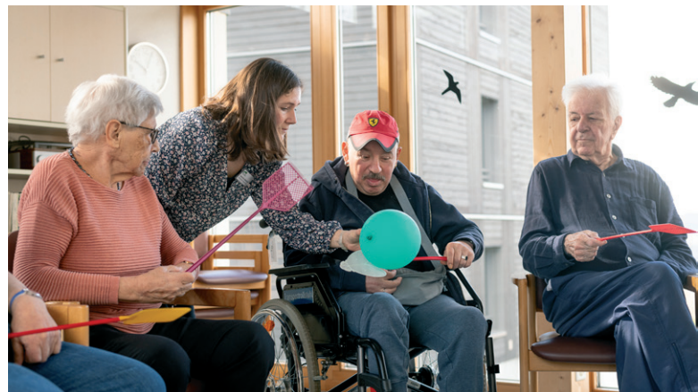
BEWOHNENDE BEIM SPIELEN IN DER AKTIVIERUNG

Damit Inklusion gelingt, braucht es klare Strukturen, gut ausgebildete Mitarbeitende und eine Kultur, die Unterschiede als Chance begreift. Ein respektvoller Umgang bildet die Grundlage. Dazu gehört, Grenzen wahrzunehmen und zugleich